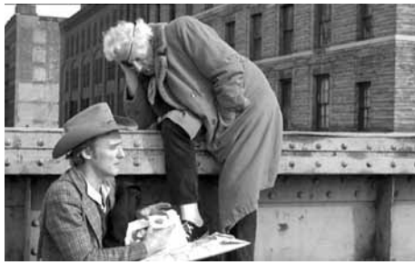
Nicholas Ray i Dennis Hopper a El amigo americano (1977)

La retrospectiva dedicada a Nicholas Ray, que va néixer el 7 d'agost de 1911, conclou aquesta quinzena amb la projecció de vuit sessions en les quals es podran veure els films següents: Run for Cover (1954), Bitter Victory (1957), King of Kings (1960), Lightning over Water (1979) i l'episodi The Janitor (1973), que el cineasta va rodar per al film Wet Dreams . Agraïments: Jos Oliver, Susan Ray, Cinemateca Portuguesa, Filmoteca Española, Svenska Filminstitutet – Cinemateket, Televisió de Catalunya i UCLA Film & Television Archive.