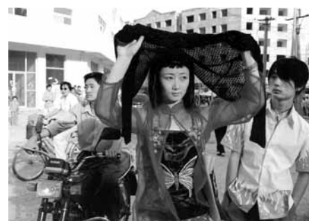
Ren xiao yao ( Plaers desconeguts ), de Jia Zhangke

També és força conegut fora de les fronteres xineses el realitzador Wang Bing, de qui projectarem JIABIANGOU (JIABIANGOU), una denúncia dels crims comesos pel règim de Mao Tse-tung a mitjan segle passat. Una altra directora amb força predicament és Liu Jiayin, autora