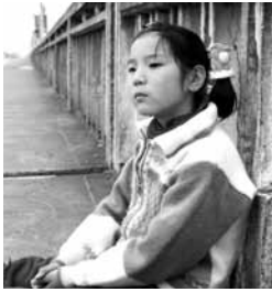
Xue Chan ( Petita cuca de llum ), de Peng Tao