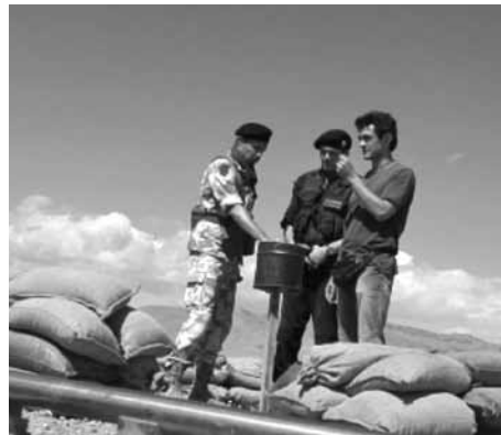
20 sigarette (2010), d'Aureliano Amadei