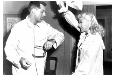
Monkey Business, de Howard Hawks (1952)

Tanmateix, la biografia de Ginger Rogers no es limita a les seves pel·lícules amb Fred Astaire. Abans de col·laborar-hi ja havia triomfat a Broadway, i a partir de 1939 va treballar en nombrosos drames i comèdies amb partenaires com ara Cary Grant, Henry Fonda, David Niven, James Stewart i Burgess Meredith, entre d'altres. Precisament amb Cary Grant va protagonitzar la comèdia que us oferim en el seu record, MONKEY BUSINESS , estrenada a les pantalles espanyoles com ME SIENTO REJUVENECER . ►