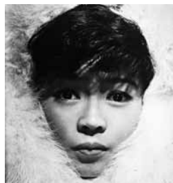
The Savage Innocents , de Nicholas Ray