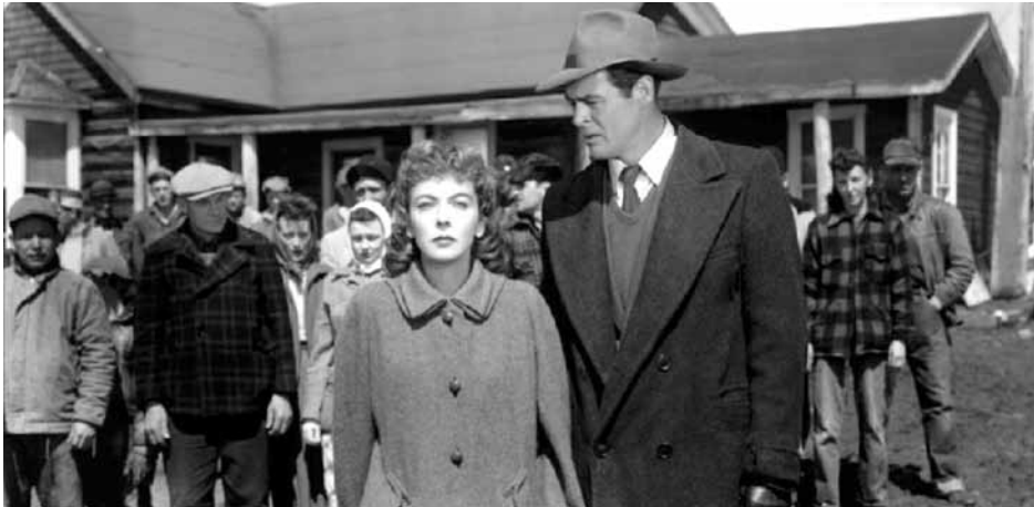
On Dangerous Ground (1950)