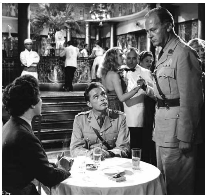
Bitter Victory (1957)

Avui podem saber amb més exactitud què volia dir Godard, per la senzilla raó que tota la seva obra com a director de cinema està justament realitzada a partir de la visió d'aquest abisme. En aquest sentit, Godard no ha