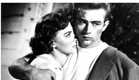
Rebel Without a Cause, de Nicholas Ray (1955)

Fins a finals de setembre podreu recuperar una de les pel·lícules més conegudes de Nicholas Ray: Rebel Without a Cause , rodada el 1955 i amb uns joves James Dean, Natalie Wood i Sal Mineo com a protagonistes. En total, seran quatre sessions dedicades a aquest retrat d'una joventut rebel, inquieta i incompresa dels EUA dels cinquanta; una joventut de classe mitjana, però que d'alguna manera exemplifica la cara fosca de l' American way of life . Rodada en CinemaScope i amb partitura de Leonard Rosenmann, Rebel Without a Cause és, doncs, un bon drama generacional que Ray omple de tensió i de força. ►