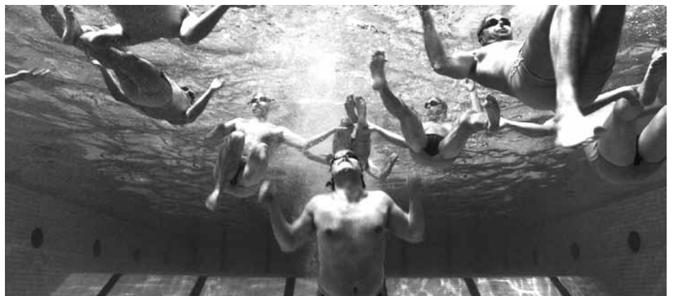
Homes sincronitzats, de Dylan Williams (2010)

Proper programa: Ombres digitals: Cinema xinès d'última generació. Rebel amb causa. Centenari de Nicholas Ray. Premis Gaudí i Premis Goya. El film del mes: La Strada . El documental del mes: Ghetto . Aula de cinema.