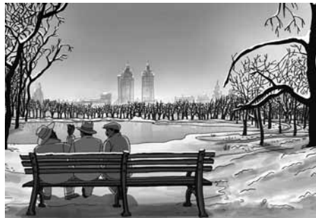
Chico y Rita, de Fernando Trueba, Javier Mariscal i Tono Errando (2011)

estat només un precursor, sinó també, sobretot a partir de PIERROT LE FOU (1965), un supervivent de si mateix. El destí de Ray va ser un altre. Posseïdor d'una mirada en què batia el sentit del cinema dels grans directors de cinema mut, format dins la seva experiència clàssica, va ser probablement el darrer dels seus representants més genuïns i, alhora, un dels primers exemples de la modernitat. Poeta al cap i a la fi, va viure al fons d'aquell abisme, desenvolupant amb valor autèntic, no exempt d'humor, el paper que el destí li havia assignat: encarnar la dramàtica aventura del cinema clàssic en la seva relació amb el modern, esgotar-la fins a la seva consumació. LIGHTNING OVER WATER ho demostra d'una manera punyent. La sentència que Godard va llançar el 1958 va resultar certa.