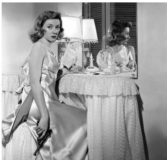
Gloria Grahame, esposa de Nicholas Ray entre 1948 i 1952, a A Woman's Secret (1949)