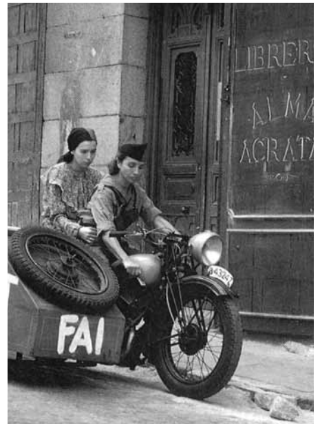
Libertarias , de Vicente Aranda (1996)