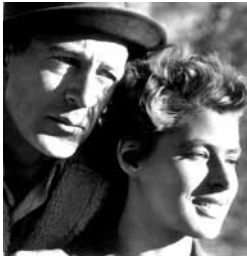
¿Por quién doblan las campanas?, de Sam Wood (1941)