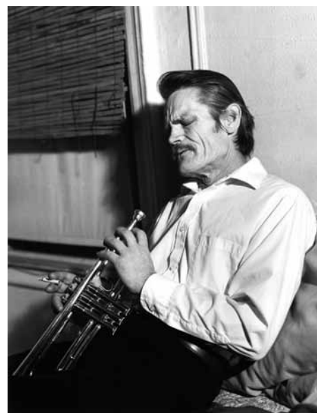
Let's Get Lost , de Bruce Webber (1988)

documentals que, atenent a les peripècies biogràfiques, a les nacionalitats o als estils dels seus protagonistes, fins i tot es podrien agrupar en certs duets ben marcats: la chanson francesa (Edith Piaf – Serge Gainsbourg); els jazzmen enganxats a l'heroïna (Dexter Gordon – Chet Baker); els poetes perifèrics (Enrique Morente – Lluís Llach), els rockers atrapatats per la psicodèlia (The Doors – The Who) o els frontmen agònics de bandes amb èxit internacional (Kurt Cobain i Nirvana – Ian Curtis i Joy Division). ▶