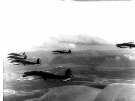
Fotograma de Legión Cóndor

La mirada cinematogràfica a la Guerra Civil i els seus efectes, però, no s'acaba aquí. La retrospectiva continuarà a la tardor amb la projecció de diversos films que, al llarg dels últims setanta-cinc anys, han aprofundit en algun aspecte concret de la confrontació o han aportat matisos que en un primer moment eren difícils de destriar. Aquesta segona etapa de Memòries de la Guerra Civil s'acompanyarà, a més, d'una exposició que inaugurarem a la nova seu del Raval i