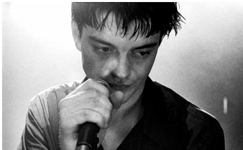
Sam Riley interpreta Ian Curtis, el turmentat líder de Joy Division, a Control (Anton Corbijn, 2010)

La cinematografia no només ha posat els ulls en el binomi tràgic que sembla existir entre «creació» i «malditisme», entès com la vida desgraciada d'uns éssers presoners entre el seu esperit i la voluntat del públic i de la indústria