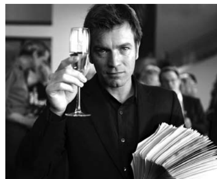
The Ghost Writer / El escritor de Roman Polanski

Veure THE GHOST WRITER és un plaer. Plaer perquè et tracta d' Homo sapiens i no d' Homo habilis , perquè esmuny un humor murri i mentrestant et consumeix en un thriller atmosfèric i brillant, et comenta alhora la mateixa extradiació de Polanski, els seus problemes amb la justícia, i la d'un polític anglès que ben bé podria ser el germà bessó de Blair, i com algú ha d'escriure tot això i potser ometre el més important. No és aquest, òbviament, el quid de la pel·lícula, però no cal