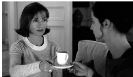
Gracias por el chocolate de Claude Chabrol

Prosseguim el recorregut per la filmografia chabroliana , amb films tant de la seva primera etapa ( Ophelia ) com amb altres de més recents, com ara Gracias por el chocolate , la segona projecció del qual anirà acompanyada d'una llarga entrevista amb Chabrol feta per Jaume Figueras el 1993 que es repetirà en el programa següent. ►