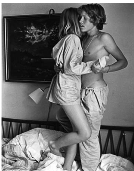
Una història d'amor de Roy Andersson

Tanmateix, és als adults a qui el realitzador reserva la seva aspror. Andersson no necessita pas forçar el tir: els adults són mostrats com minvats per l'estretor de llur horitzó, tant públic com privat, professional o familiar. El pare d'Annika, que secretament espera que la seva filla el vengui de totes les seves desil·lusions,