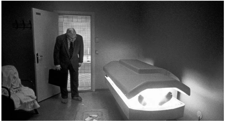
Cançons del segon pis de Roy Andersson

Roger Clarke (Sight & Sound, abril de 2008) ▶