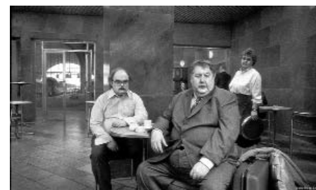
Cançons del segon pis de Roy Andersson

R.: És cert que sempre m'han atret els «tipus», per la qual cosa sovint m'adreço als no professionals. A SÅNGER FRÅN ANDRA VÅNINGEN només hi ha dos actors professionals, i és la primera vegada que recorro a tants afeccionats. De fet, no veig pas tant la diferència quan treballa amb uns o amb els altres. Fem moltíssimes repeticions, i a mesura que passen els dies, els no professionals esdevenen autèntics actors. Suècia és un país petit, i els actors fan sovint teatre; hom els veu al cine-