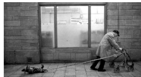
La comedia de la vida de Roy Andersson

Jean A. Gili (Positiv, núm. 568, juny de 2008) ▶