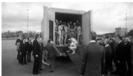
Món de glòria de Roy Andersson

Una seqüència de PLAY TIME pot servir per fer-nos una idea de la pel·lícula: el moment en què Hulot es troba en una drugstore , on la llum verda del rètol imprimeix un to sinistre tant als dolços que regnen a l'aparador com als clients amb aspecte estrany. Un pla ample, bastant llarg, que deixa a l'espectador prou temps per apreciar l'essència de la situació. Traiem-ne Hulot, mantinguem-hi el