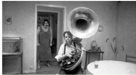
La comedia de la vida de Roy Andersson

Michel Ciment i Yann Tobin (Positif, núm. 476, octubre de 2000) ▶