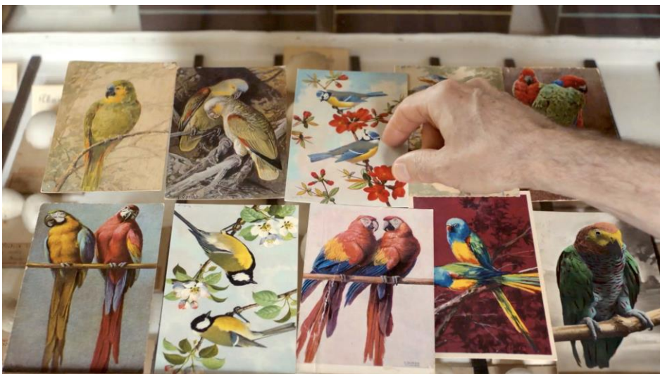
Fotograma del film Langue des oiseaux (Érik Bullot, 2022)

Acull a músics i artistes, en seqüències escenificades, per un col·loqui lúdic dels ocells, musical i filosòfic, convidant l'espectador a reflexionar sobre les modalitats d'una comunicació ampliada.