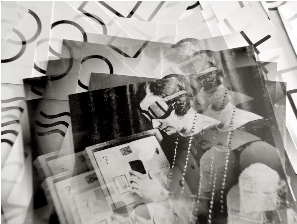
Érik Bullot. Sèrie Kaléidoscope , 2022

Per a l'exposició a la FilmoTeca, Bullot actualitza la hipòtesi d'un cinema vivent o desmaterialitzat a través d'un relat poètic i una investigació rigorosament documentada d'algunes de les obsessions o quimeres que el cinema ha deixat enrere.