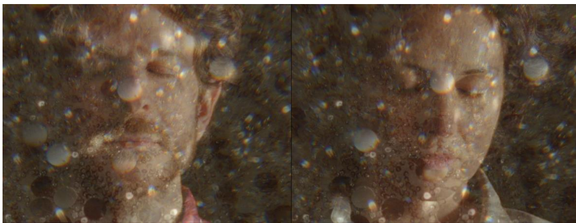
Fotograma del film Fragments pour un film imaginaire (Érik Bullot, 2023)