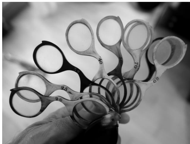
Érik Bullot. Sèrie Kaléidoscope , 2022

Inauguració dijous 28 de setembre a les 19.00 h a la Sala Laya amb la conferència performativa d'Érik Bullot Cinema imaginari .