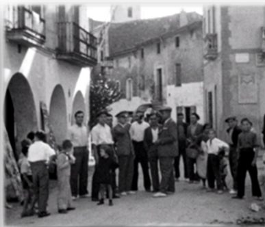
MOSAIC Nº 2. FESTA MAJOR Eusebi Ferré Borrell, 1933