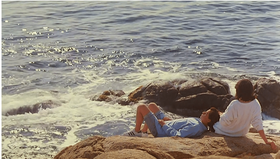
Costa Brava (Marta Balletbò-Coll, 1995)