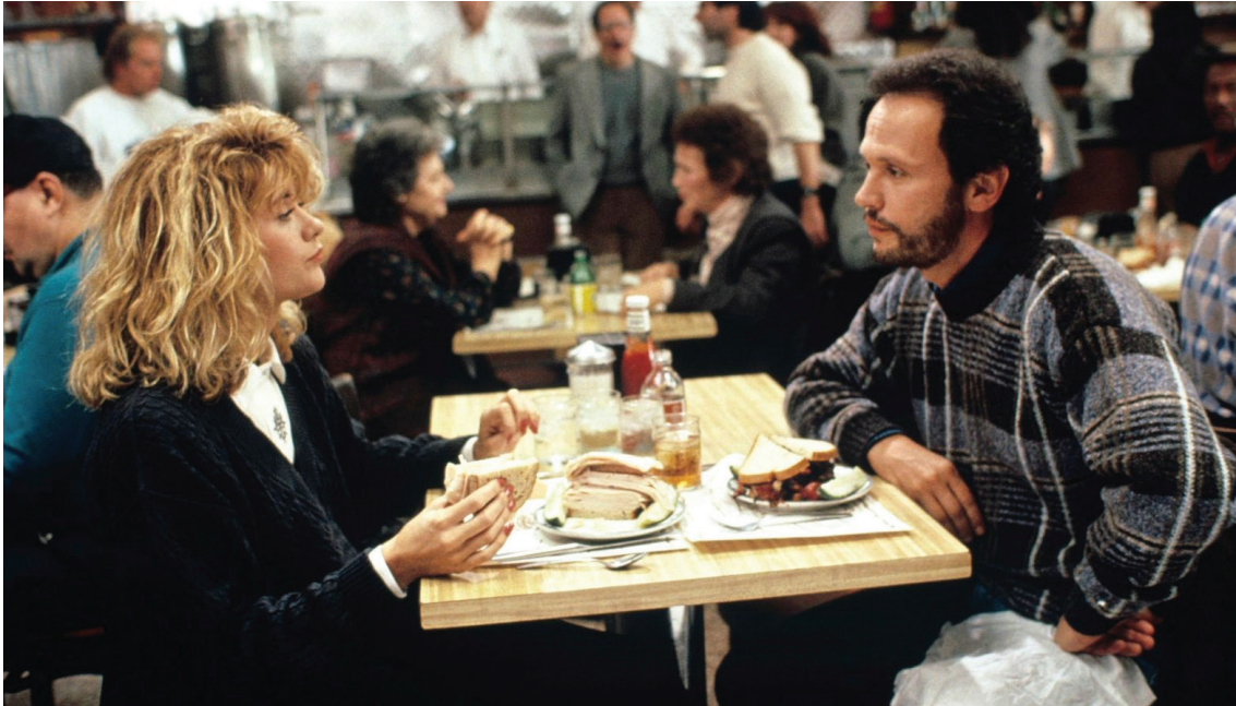
When Harry Met Sally... (Rob Reiner, 1989)

Què és, exactament, una comèdia romàntica? Dues persones destinades a trobar-se? Una batalla de gèneres amb final feliç? Un mecanisme perfecte de rèpliques enginyoses contingut dins d'una matrioixca de malentesos? Tu i jo, què? proposa un recorregut per un dels gèneres més populars, mutants i persistents de la història del cinema: un territori on les formes del desig, les convencions socials i les fantasies sentimentals es negocien a cop de diàleg.