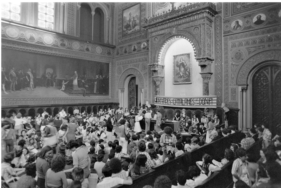
Jornades Catalanes de la Dona.

Durant la primavera de 1976, del 27 al 30 de maig, es van celebrar al Paraninfo de la Universitat de Barcelona les Primeres Jornades Catalanes de la Dona, unes trobades ciutadanes en què, amb perspectiva feminista, es debateren i es manifestaren públicament les demandes i reivindicacions de les dones, amb la voluntat de millorar les seves condicions de vida i combatre les opressions que els havien estat imposades pel franquisme i per unes estructures socioeconòmiques marcadament heteropatriarcals. En les jornades bategaven el desig i la voluntat no només de lluitar per la paritat de les dones dins les estructures socials existents, sinó més aviat de construir una societat nova, més paritària i lliure. Aquestes jornades van marcar l'eclosió de l'anomenada segona onada del moviment feminista a Catalunya, i van promoure la creació i el desenvolupament d'un gran nombre d'entitats, iniciatives i propostes polítiques transformadores que van contribuir de manera important a la consecució de més drets i llibertats per a les dones.