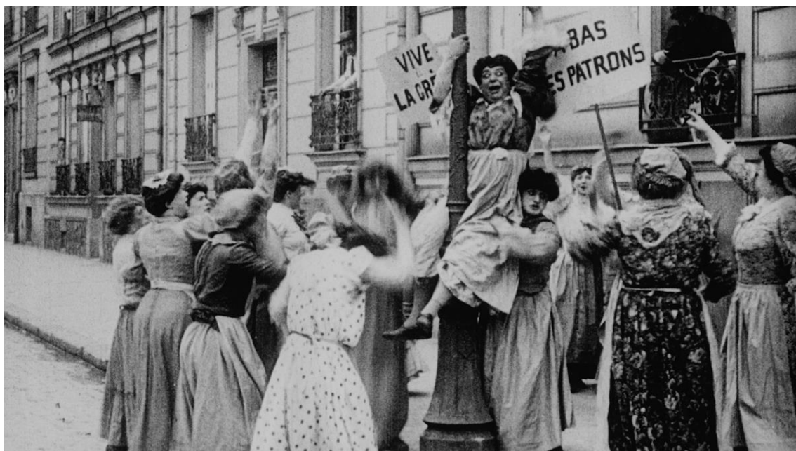
Afins: Nasty Women . La grève des bonnes

Despleguem una constel·lació d'afinitats a partir de figures femenines del cinema mut que van desafiar l'ordre social a través de la comicitat i el caos. Les primeres Nasty Women del cinema subvertiren jerarquies i anticiparen formes de resistència que troben ressonància en els debats contemporanis sobre gènere i poder.