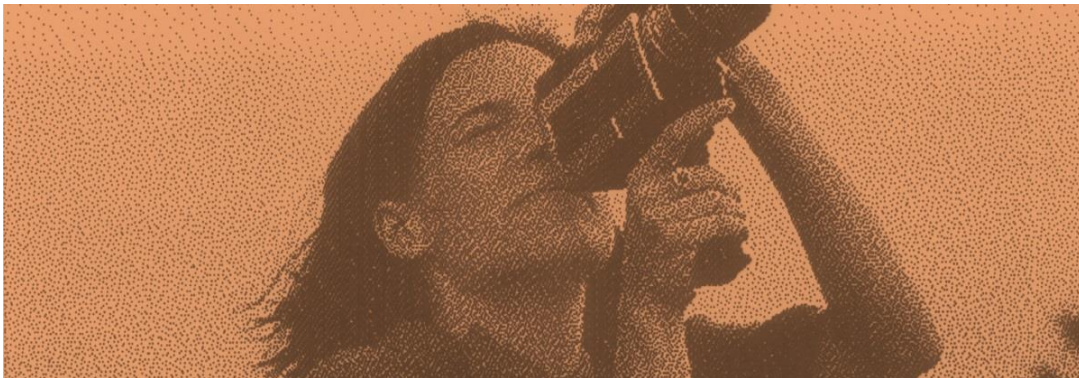
Carla Simón

Del 9 de juliol al 29 de novembre de 2026