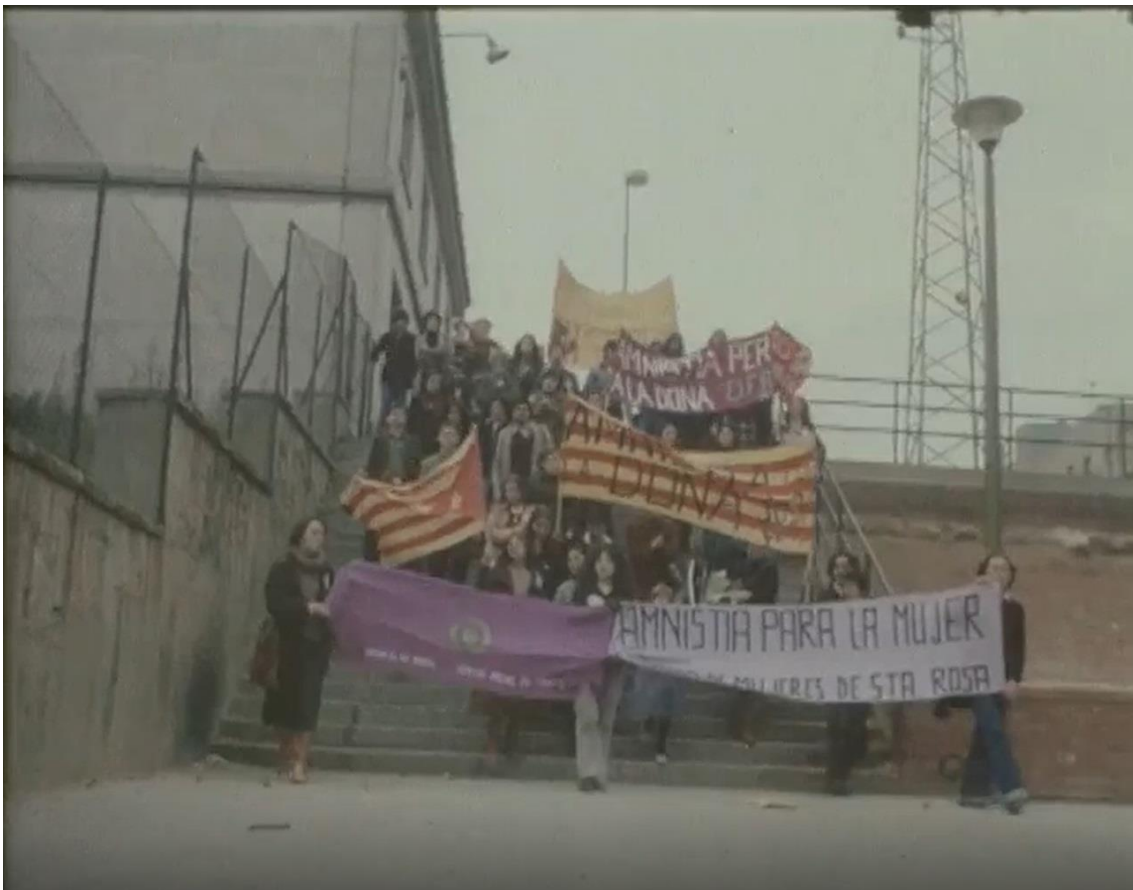
Fotograma de Noticiari de Barcelona, núm 12. Feminisme. els moviments feministes (ICC, 1977)

Aquesta secció recull documents, fotografies i reportatges de les Jornades, i també presenta un recull d'algunes peces audiovisuals que han documentat l'evolució del feminisme, els seus idearis i la seva concreció en accions militants en el context català i espanyol, des de moments anteriors al 1976 fins a les fites del moviment immediatament posteriors a aquest esdeveniment. Es tracta de documents conservats a la col·lecció de la FilmoTeca i en arxius d'entitats que han desenvolupat una tasca primordial en la preservació i la catalogació dels fons relacionats amb el feminisme d'aquella època.