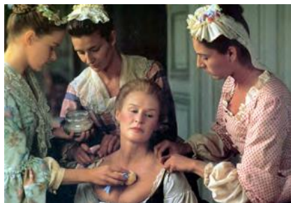
Dangerous Liaisons (Stephen Frears, 1988)

Stephen Frears, hereu del Free Cinema i format a la televisió, ha consolidat una filmografia basada en retrats corrosius que no deixen de tenir un toc entranyable al voltant de personatges com els de My Beautiful Laundrette , The Van , The Queen o Florence Foster Jenkins . És especialista en biopics i ha fet incursions puntuals en el cinema nord-americà.