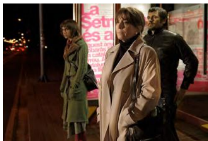
53 días de invierno (Judith Colell, 2006)

Va ser Gaudí d'Honor el 2018 i té una trajectòria esplèndida al teatre, la televisió i el cinema. En aquest terreny, li donarem carta blanca perquè triï els seus films preferits, com a espectadora i d'una collita pròpia que inclou Gary Cooper, que estás en los cielos , Silencio roto , 53 dies d'hivern i Hablar .