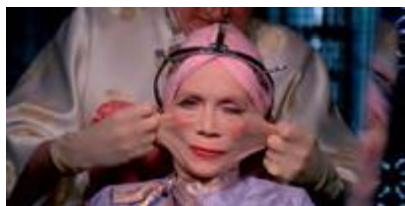
Brazil (Terry Gilliam, 1985)

Acabat el seu desitjat projecte The Man Who Killed Don Quixote , arriba el moment de revisar l'obra del més britànic dels cineastes nord-americans. Integrant dels mítics Monty Python, ha fet carrera en solitari amb fantasies tan visionàries com Brazil i Fear and Loathing in Las Vegas , sense oblidar la incursió operística amb Benvenuto Cellini . Amb la presència de Terry Gilliam.