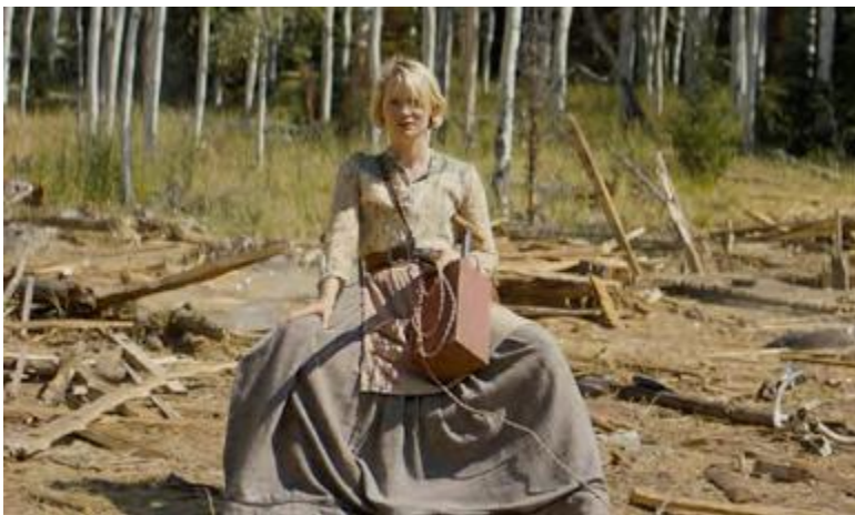
Damsel (David Zellner, Nathen Zellner, 2018)

Americana. Festival de Cinema Independent Nord-americà de Barcelona (març)