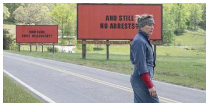
Three Billboards Outside Ebbing, Missouri (Martin McDonagh, 2017)

Una recopilació dels millors films del 2017 segons els crítics de cinema ( gener-març ).