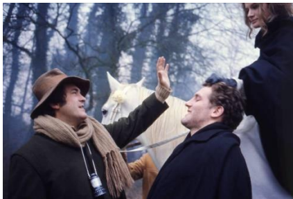
Rodatge de Novecento (1976)

Fill d'un poeta, Attilio Bertolucci, i hereu d'un altre poeta, Pier Paolo Pasolini, l'obra de Bernardo Bertolucci va créixer sota el signe de Marx i Freud. Posteriorment exploraria territoris exòtics de la mà de Mao o Buda sense abandonar complexos edípics ni drames intimistes. La seva mort ens deixa orfes però la seva obra ens seguirà il·luminant.