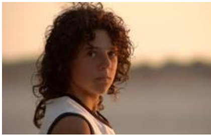
La leyenda del tiempo (Isaki Lacuesta, 2006)

En quinze anys ha rodat nou llargmetratges, però també ha proposat diverses instal·lacions amb el cinema com a eina polivalent. Va guanyar la Concha d'Or a Sant Sebastià i és objecte d'una retrospectiva antològica al Centre Pompidou que arriba a Catalunya de la mà de la seva complicitat amb la FilmoTeca.