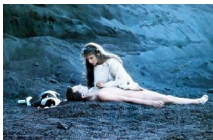
El caballero del dragón (Fernando Colomo, 1985)

Ha dissenyat decorats per a Pedro Almodóvar, Imanol Uribe, Jaime Camino o Pilar Miró. Ha estat guardonat amb cinc premis Goya i és un d'aquests creadors de somnis que transformen la realitat per donar vida, a la pantalla, a escenaris indistintament històrics i contemporanis. Una selecció dels seus films acompanyarà una exposició de les seves eines de treball.