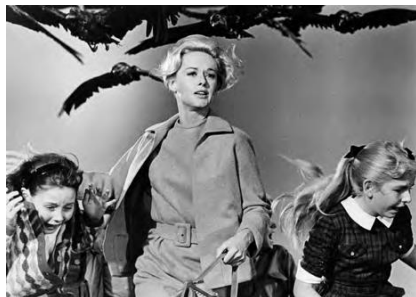
The Birds (Alfred Hitchcock, 1963)

Joan Brossa té butaca pròpia a la Filmoteca. Celebrem el centenari del seu naixement amb dotze instantànies que, de ben segur, no s'hauria perdut: de Hitchcock a Delvaux, de l'avantguarda soviètica als germans Marx. I sempre amb aquell toc surrealista i màgic que caracteritza els seus poemes tan cinematogràfics.