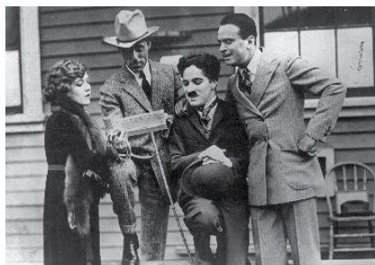
Mary Pickford, David Wark Griffith, Charlie Chaplin i Douglas Fairbanks

Charles Chaplin, Mary Pickford, Douglas Fairbanks i David W. Griffith van crear una productora per defensar els seus interessos artístics i creatius. Els dos primers van mantenir-ne les seves accions fins a mitjan anys cinquanta i la seva empremta es pot apreciar en grans títols, propis i aliens, que van fer d'aquesta empresa un dels principals motors del Hollywood clàssic.