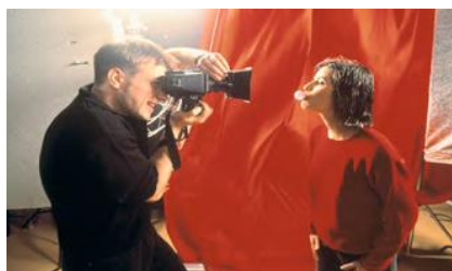
Trois couleurs: Rouge (Krzysztof Kieślowski, 1994)

Una exposició de fotografies fetes pel director d' El decàleg mentre estudiava a Lodz ens impulsa a revisar la filmografia existencial d'un cineasta polonès que va desaparèixer massa d'hora, just quan la seva anomenada "Trilogia dels tres colors (blau, vermell i roig)" el va consagrar com un dels grans cineastes europeus.