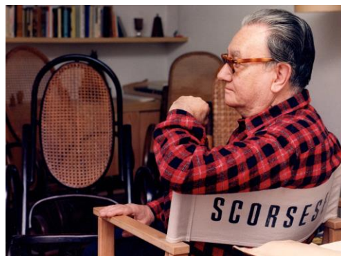
Joan Brossa: © Martí Gasull, 1990. Fundació Joan Brossa

Joan Brossa va ser un espectador habitual, gairebé diari, de la Filmoteca a l'antiga sala de la Travessera de Gràcia, on sempre s'asseia al mateix lloc, i ho va continuar sent quan va traslladar-se a l'avinguda de Sarrià. Des que la Filmoteca és al Raval, a la Sala Chomón, hi ha "la butaca d'en Brossa", una butaca vermella enmig de la platea de seients negres, un homenatge al gran creador i amic de la Filmoteca en forma de poema visual. I aquest 2019 la Filmoteca s'afegeix als actes de l'Any Brossa, en motiu del centenari del naixement del poeta, dedicant-li un cicle i incorporant un dels poemes visuals que Brossa va donar a la Filmoteca (Hitchcock, 1982) com a imatge de la programació de 2019.