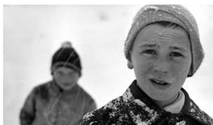
Krzysztof Kieślowski fotografia la ciutat de Lodz, ca. 1968-1969

Aquesta mostra, produïda pel Museu de Cinematografia de Lodz, documenta la vida personal i la trajectòria artística del director d' El decàleg . N'ampliarem el contingut amb material que es va poder exhibir al Festival de Cinema de Sant Sebastià el 2005: una col·lecció de cartells de pel·lícules del director, així com una trentena de fotografies fetes pel mateix realitzador mentre estudiava a la ciutat de Lodz (1965-1966).