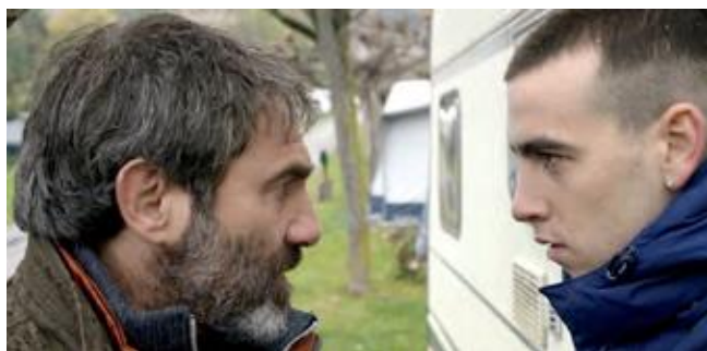
La propera pell (Isaki Lacuesta, 2016)

A més de la Filмотeca i A Bao A Qu, en aquest programa europeu participen institucions d'arreu d'Europa, com el Centre for the Moving Image d'Escòcia, el British Film Institute o la Cinémathèque française, a més d'entitats com Meno Avilys de Lituània i l'Associação Cultural Os Filhos de Lumière de Portugal.