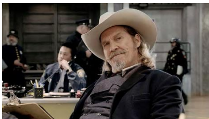
RIPD. Rest In Peace Department (Robert Schwentke, 2013)

És fill i germà d'actors i porta el cinema a les venes. Se sent còmode a la pell de perdedors, com els de The Last Picture Show o Fat City . Va guanyar l'Oscar amb Crazy Heart i no fa gaire l'hem vist a Hell or High Water . A més de la seva presència davant les càmeres, també ha exercit com a fotògraf, cosa que tindrem l'ocasió de comprovar amb una exposició.