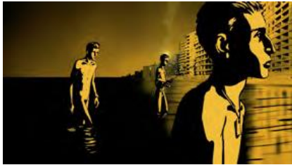
Waltz with Bashir (Ari Folman, 2008)

El cinema d'animació s'associa, majoritàriament, a un públic infantil. Hi ha, però, tota una altra producció cinematogràfica que substitueix els actors de carn i ossos pel traç animat destinat a adults i sense restriccions de gèneres ni temàtiques. Chico y Rita , Waking Life , Persepolis i Isle of Dogs marquen els grans trets d'aquest cicle.