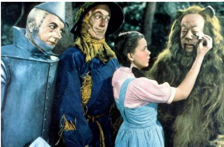
The Wizard of Oz (Victor Fleming, 1939)