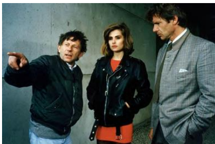
Roman Polanski, Emmanuel Seigner i Harrison Ford al rodatge de Frantic (1988)

Des que el 1988 van coincidir a Frenético , el cineasta polonès i l'actriu francesa formen un tàndem indissociable a la vida real i a la pantalla. Tenen la seva pròpia carrera per separat, però la conjunta, i ben compenetrada, es fonamenta en Lunas de hiel , La novena porta , La Venus de les pells o Basada en hechos reales .