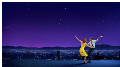
La La Land (Damien Chazelle, 2016)

Parlar de programació refrescant per a l'estiu és un tòpic. I quin millor ingredient per aconseguir-ho que un cicle de cinemes musicals. En plural. Els de la Metro, òperes rock, concerts antològics i biopics de compositors i intèrprets. Fred Astaire i Charlie Parker, Liza Minnelli i Janis Joplin. No hi seran tots, però gaudireu de tots els que hi seran.