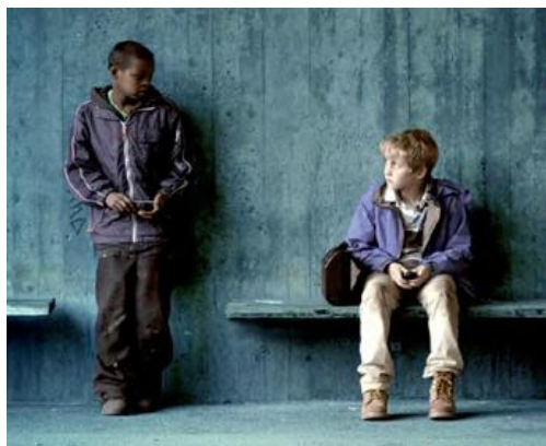
Play (Ruben Östlund, 2011)

FilmoXarxa és un nou projecte que pretén potenciar la difusió del cinema català i europeu a les pantalles catalanes. Aquesta nova iniciativa de la Filmoteca de Catalunya i l'Institut Català de les Empreses Culturals (ICEC), amb la complicitat de la Federació Catalana de Cineclubs, la Direcció General de Política Lingüística i l'Agència Catalana de Cooperació al Desenvolupament, pretén donar compliment a l'article 24 de la Llei del Cinema (Llei 20/20, del 7 de juliol de 2010) que encarrega a l'ICEC la creació d'una xarxa concertada de pantalles cinematogràfiques. L'objectiu de FilmoXarxa és triple: potenciar i difondre el cinema català i europeu, incrementar l'oferta cinematogràfica en llengua catalana a les pantalles del país i fomentar la cultura cinematogràfica entre la ciutadania catalana.