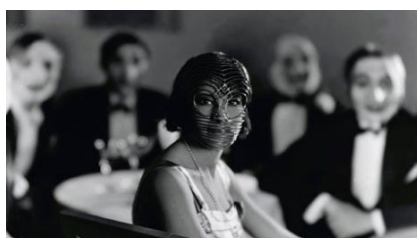
Dainah la métisse (Jean Grémillon, 1932)

El cinema es crea i, de vegades, es destrueix, però, sobretot, es transforma. Les censures han manipulat pel·lícules i l'olfacte dels productors les ha fet modificar a gust del públic, però les filmoteques les conserven i restauren. Amb la col·laboració d'altres institucions, farem un repàs de clàssics que, darrerament, han tornat a la llum amb tot el seu esplendor.