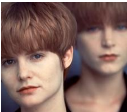
Single White Female (Barbet Schroeder, 1992)

És productor còmplice de la Nouvelle Vague i els seus films com a director, rodats a mig món, alternen el documental amb la ficció per retratar arreu del món personatges inquietants: dictadors africans, escriptors alcohòlics, milionaris sospitosos, narcotraficants colombians o advocats propers al terrorisme.