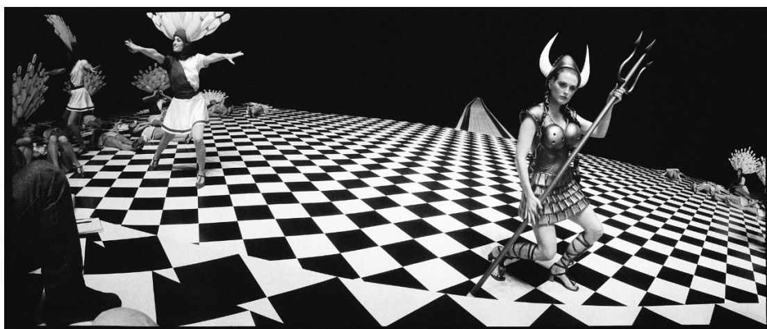
Julianne Moore, Valkyrie, The Dude's Dream

Una setantena de fotografies mostren un vessant desconegut de l'oscaritzat actor Jeff Bridges. Imatges captades amb la seva càmera Widelux amb pel·lícula de 35 mm en blanc i negre documenten els seus rodatges des de mitjan anys setanta.