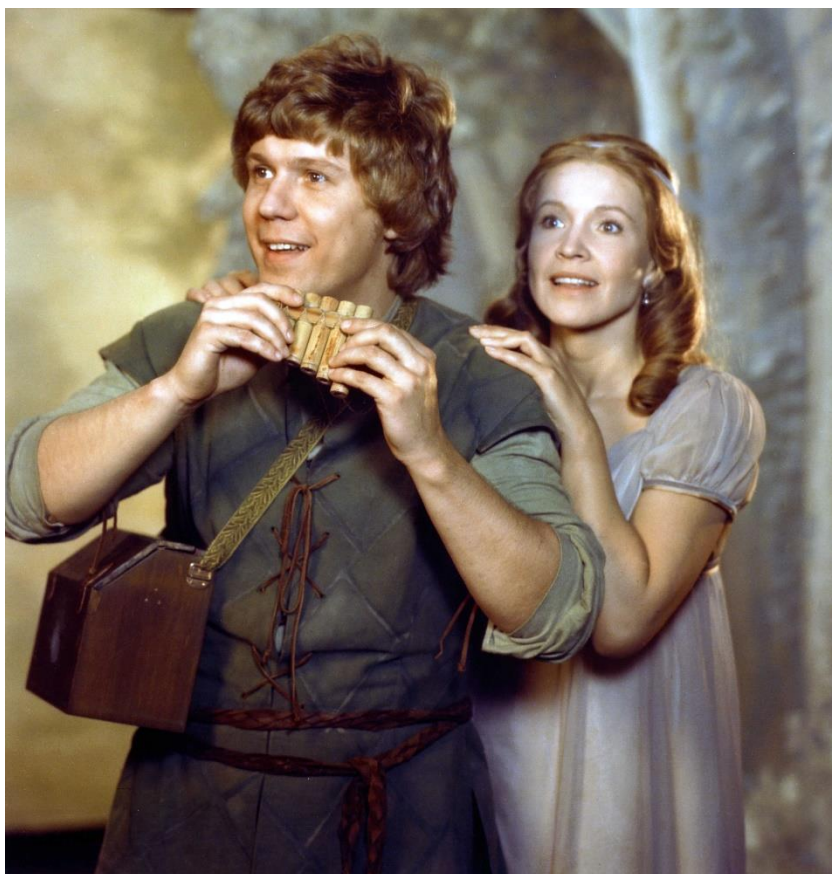
La flauta màgica (Ingmar Bergman, 1975)