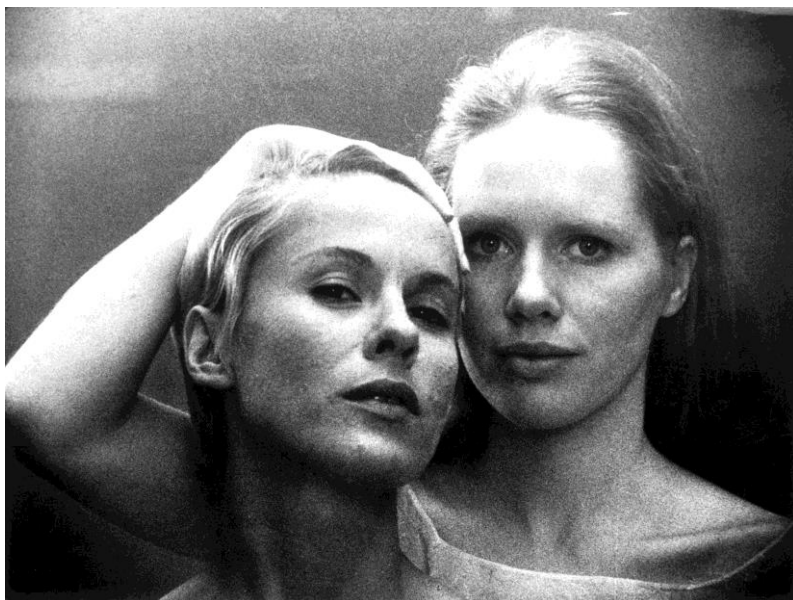
Persona (Ingmar Bergman, 1966)

Pocs cineastes han sabut copsar l'esperit humà amb tanta intensitat com Ingmar Bergman, de qui se celebra ara el centenari del naixement. A la psicologia i la metafísica com a instruments d'exploració, s'hi afegeix la seva experiència teatral a l'hora de treballar amb actors com Liv Ullmann, Max von Sydow, Erland Josephson o Ingrid Thulin. Revisem extensament una filmografia que va del blanc i negre dels seus primers films al roig i negre de Crits i murmuris ; dels drames a la comèdia ( Somriures d'una nit d'estiu ); de la ficció al documental ( Farö dokument ), o del cinema als formats televisius d' Escenes d'un matrimoni i Fanny i Alexander .