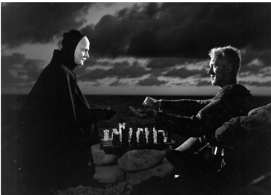
El séptimo sello (Ingmar Bergman, 1957)

Els inextricables problemes existencials i les amargors lacerants dels seus drames van ser premiats amb tres Oscars pels films La font de la donzella , Com en un mirall i Fanny i Alexander . Aquests reconeixements es van veure superats el 1997 quan un nodrit grup de prestigiosos cineastes el va escollir com el director més important del segle XX per rebre a Cannes la Palma d'Or honorífica del cinquantenari.