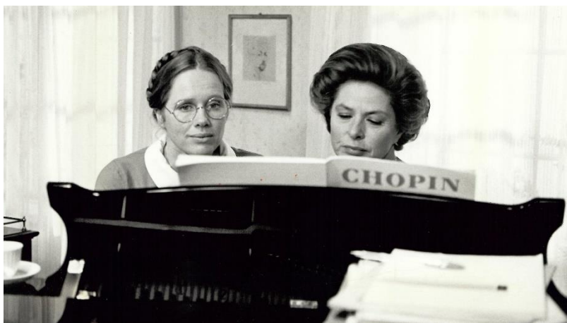
Sonata de otoño (Ingmar Bergman, 1978)